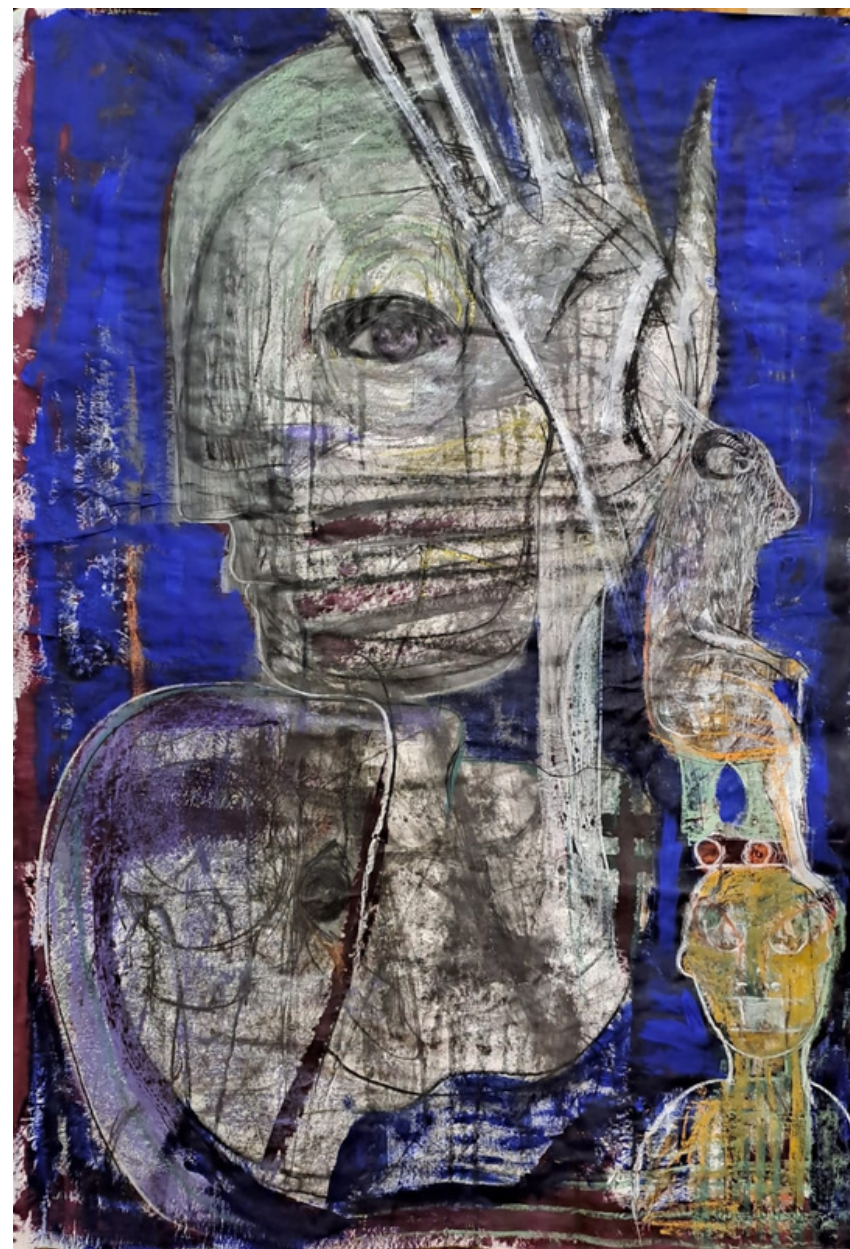
SENZA TITOLO 100x150 cm acrilico grafite e gessetti su carta