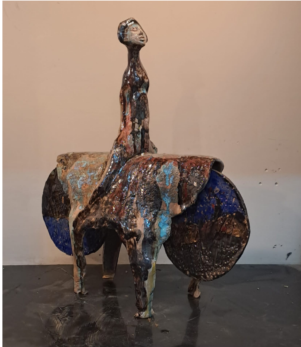
PACHIDERMI SENZA MEMORIA #17 63x60x26 cm terracotta policroma