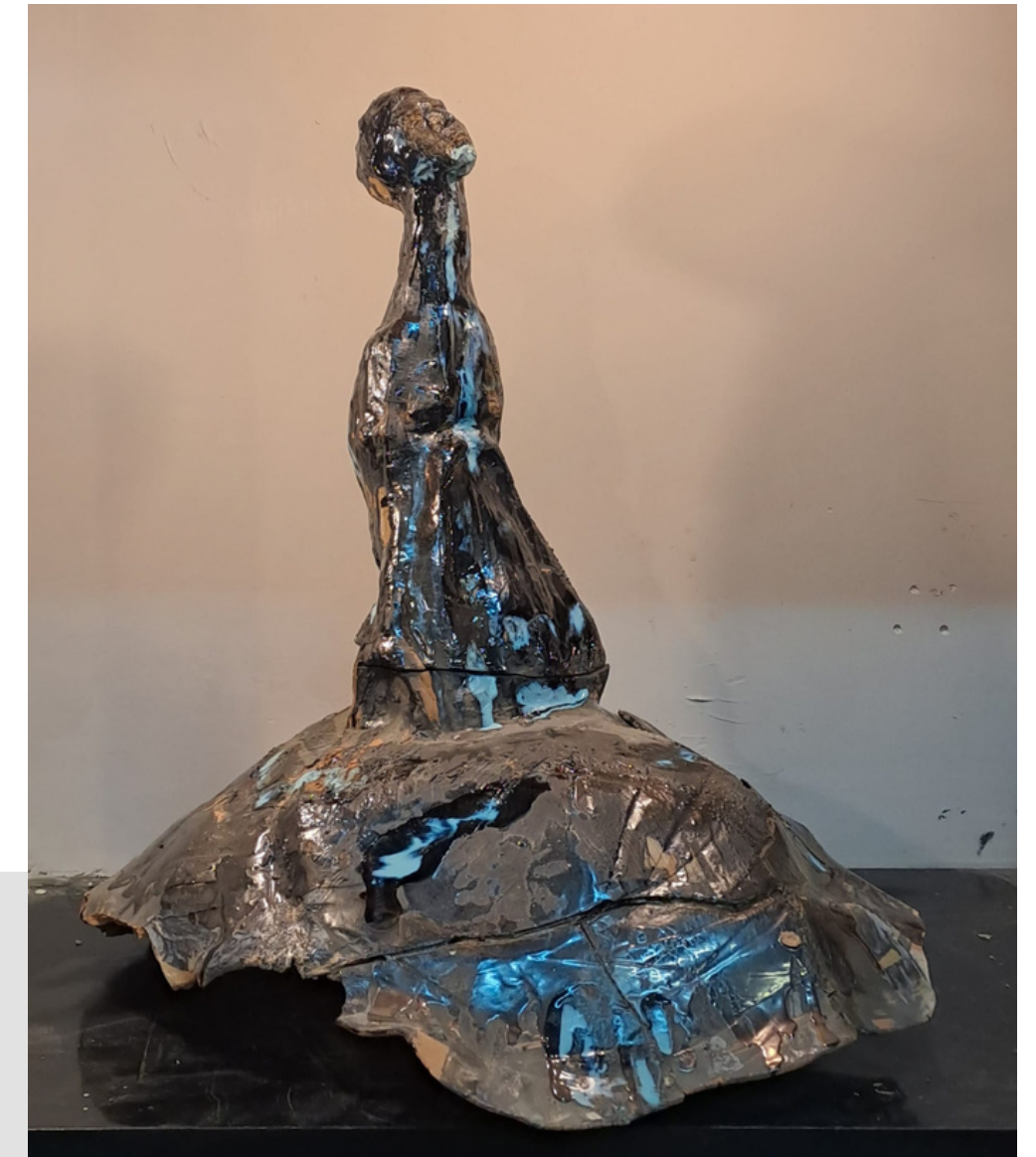
SENZA TITOLO 80x70x40 cm terracotta policroma