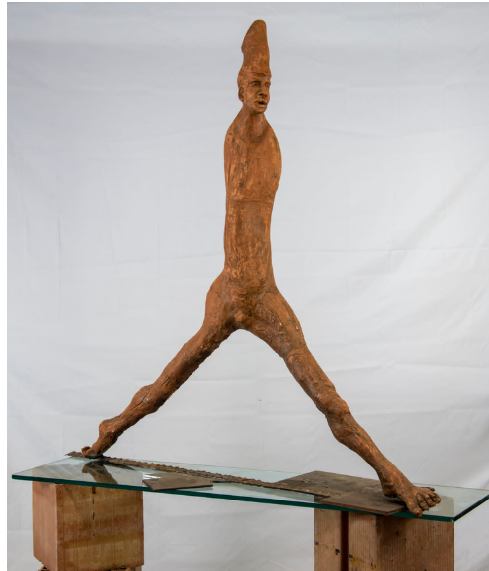
IL POPOLO IN CAMMINO 100x100x30 cm terracotta satinata a cera