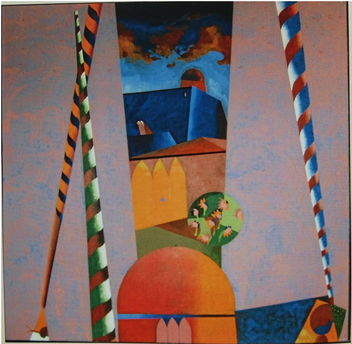
"Ricordi in viaggio - anno 1995 Tecnica acrilico su tela cm.100X100