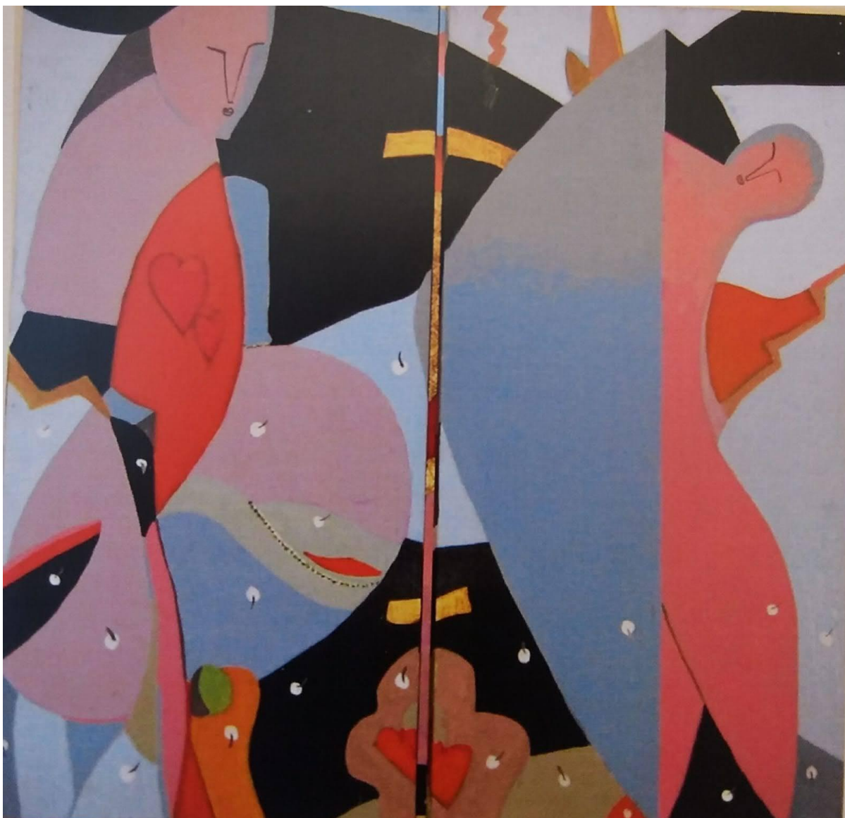
"Emozioni" - anno 2005